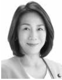
北海道商工連盟会長 参議院議員(北海道選挙区)

国」よりも、私たちは国民生 活の安心を守る政治を実現 するための政策提言を行い、 その実現に向けて、これから も全力で取り組み続けてま いらいます。